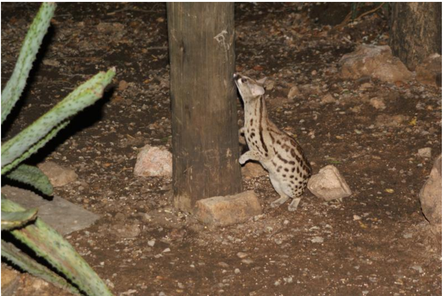
De genetkat bij onze voederplaats