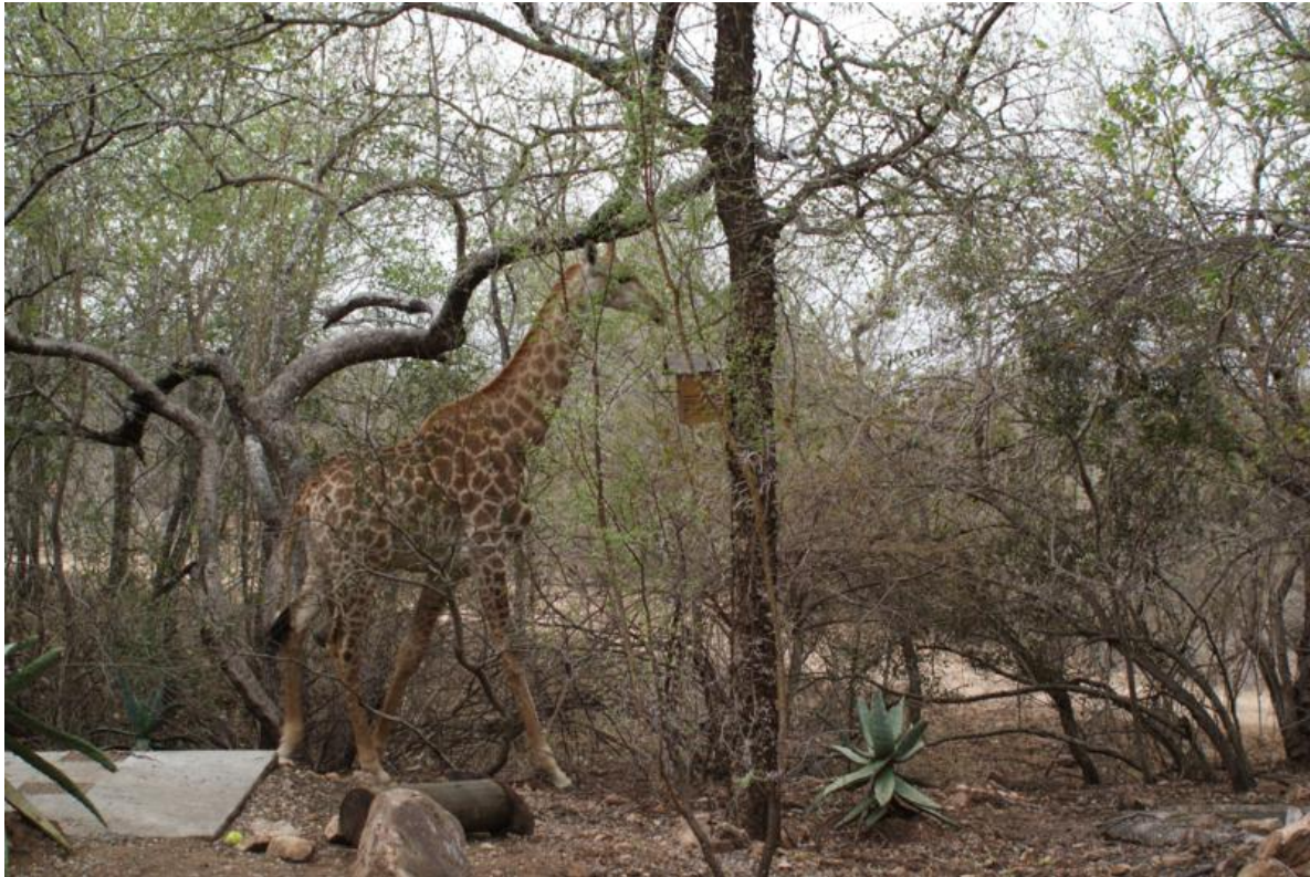
Giraf in de tuin van MHOFU!

Het verslag: Het was heerlijk. Het huis en de tuin zijn geweldig. Je verwacht wel een aantal dieren in de tuin. Maar zo veel! We hebben regelmatig gebruid.