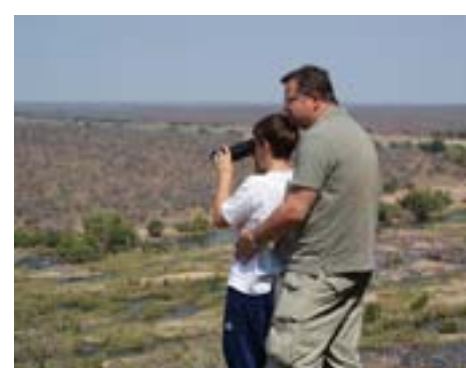
We zijn 2x naar Swaziland geweest. De 1 ste keer hebben we een tocht door de bergen gemaakt. Een prachtige omgeving.